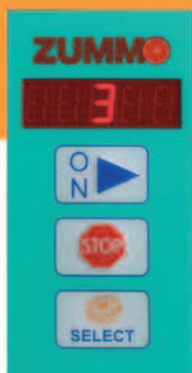
PROGRAMADOR Y CONTADOR DIGITAL PROGRAMMER AND DIGITAL COUNTER